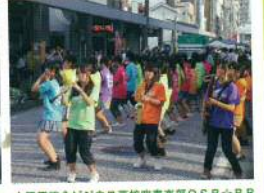
小田原総合ビジネス高校吹奏楽部OSB☆BB